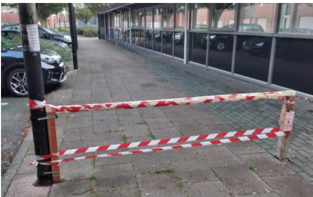
Tijdelijke oplossing gemaakt door buurtbewoner

Het voetpad loopt vanaf de Galecopperdijk, over het bruggetje, langs het buurtplein richting het winkelcentrum. In de praktijk rijden er regelmatig fietsers of scooters over het voetpad. Bewoners hebben aangegeven dat met name mensen die slecht ter been zijn deze situatie als onveilig ervaren. Een buurtbewoner heeft deze signalen eind augustus doorgegeven aan de gemeente en zelf een rood/wit lint aangebracht. Na overleg met de bewoner heeft de gemeente toegezegd om dit najaar met een voorstel te komen. De tijdelijke oplossing met het rood/witte lint werd gedoogd, totdat deze versterkt werd met een plank. De gemeente vond deze oplossing niet meer verantwoord en heeft het daarom verwijderd.